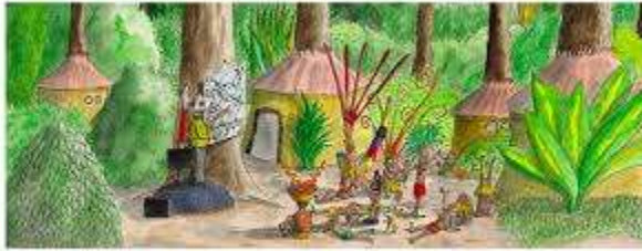
We started with Participatory Community Development...

11. Presenta en tu carpeta de evidencias un escrito explicando qué caracteriza a una sociedad cuyo modelo de desarrollo es sostenible.