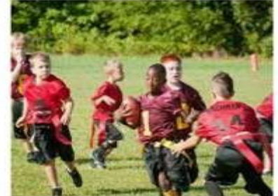
La llegada de los deportes alternativos ... auca.es