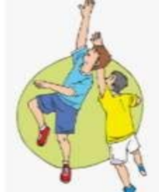
Deportes y juegos alter... abc.com.py