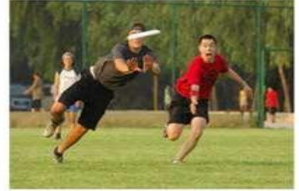
Deporte Alternativo - EcuRed ecured.cu