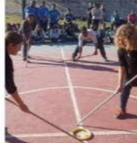
Deportes alternativos, una ... mendovoz.com