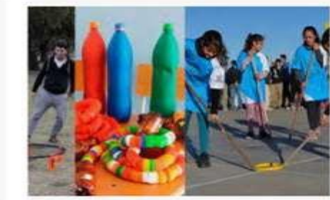
Deportes alternativos para pasar la cuarentena jujuvaimomento.com