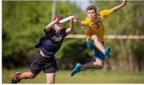
Qué son los deportes alternativos? elcierre digital.com