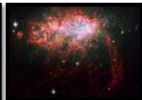
Irregular (NGC 1569)