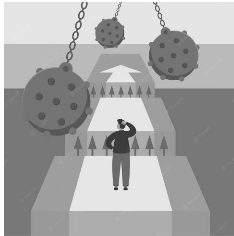
Ilustración 1 Freepik Vector Premium