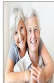
Ilustración 22: Etapa de la Ancianidad