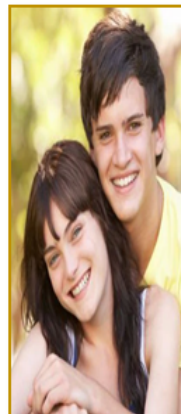
Ilustración 19: etapa de la adolescencia