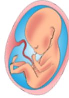
Ilustración 16: Etapa prenatal