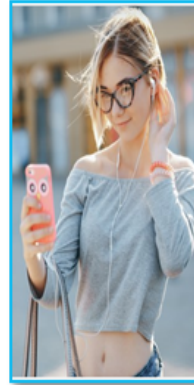
Ilustración 20: Etapa de la juventud Fuente: Freepik. (2019). Modificado por González, J. (2019).