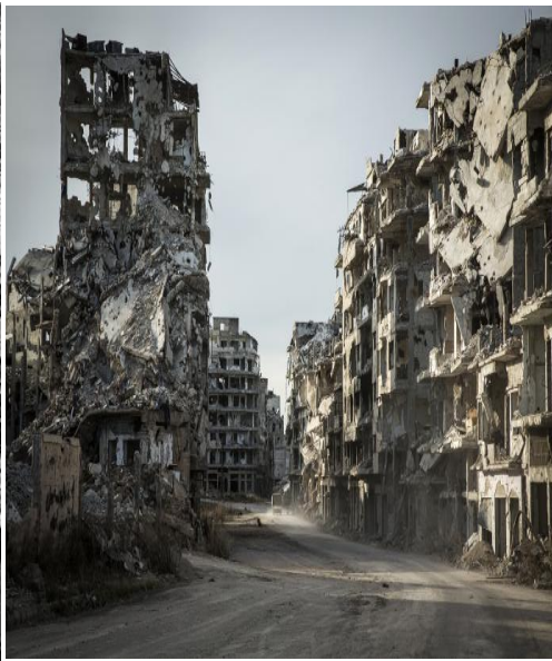
Guerra en Siria en 2013