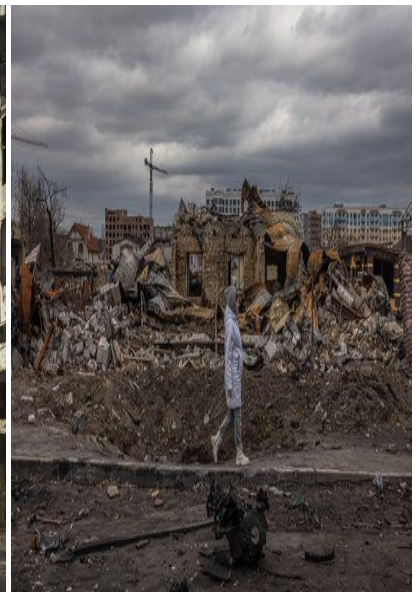
Guerra en Ucrania 2022