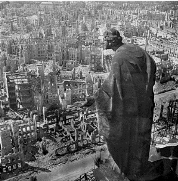
Alemania. Segunda Guerra Mundial. Febrero de 1945