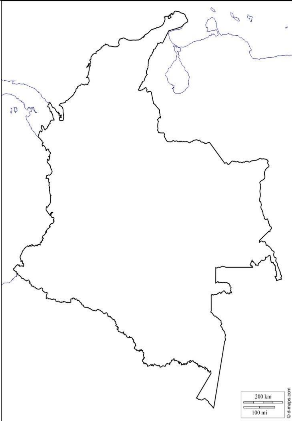
Mapa para ubicar división política ubica las cordilleras y mares.