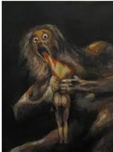
Saturno (Cronos) devorando a sus hijos, Goya

El tema de conflicto padre-hijo se repitió cuando Cronos se enfrentó con su hijo, Zeus. Tras haber traicionado a su padre, Cronos temía que su descendencia hiciera lo mismo, por lo que cada vez que Rea daba a luz un hijo, él lo secuestraba y se los tragaba. Rea lo odiaba y lo engañó escondiendo a Zeus, el último de sus hijos, y envolviendo una piedra en pañales, que Cronos se tragó. Rea crió a Zeus en el monte Ida de Creta, siendo alimentado por una cabra, cuando Zeus creció, dio a su padre un veneno que lo obligó a vomitar a sus hermanos y a la piedra, que habían permanecido en el estómago de Cronos todo el tiempo.