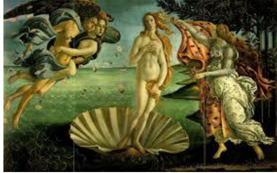
El nacimiento de Venus (Afrodita), Botticelli

El tema de conflicto padre-hijo se repitió cuando Cronos se enfrentó con su hijo, Zeus. Tras haber traicionado a su padre, Cronos temía que su descendencia hiciera lo mismo, por lo que cada vez que Rea daba a luz un hijo, él lo secuestraba y se los tragaba. Rea lo odiaba y lo engañó escondiendo a Zeus, el último de sus hijos, y envolviendo una piedra en pañales, que Cronos se tragó. Rea crió a Zeus en el monte Ida de Creta, siendo alimentado por una cabra, cuando Zeus creció, dio a su padre un veneno que lo obligó a vomitar a sus hermanos y a la piedra, que habían permanecido en el estómago de Cronos todo el tiempo.