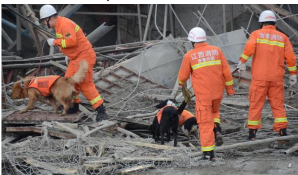
El trabajo decente dignifica, permite el desarrollo de capacidades y ofrece satisfacciones personales.

Respetando las normas básicas para la presentación de trabajos. Leer y elaborar un ensayo Que es el trabajo decente la