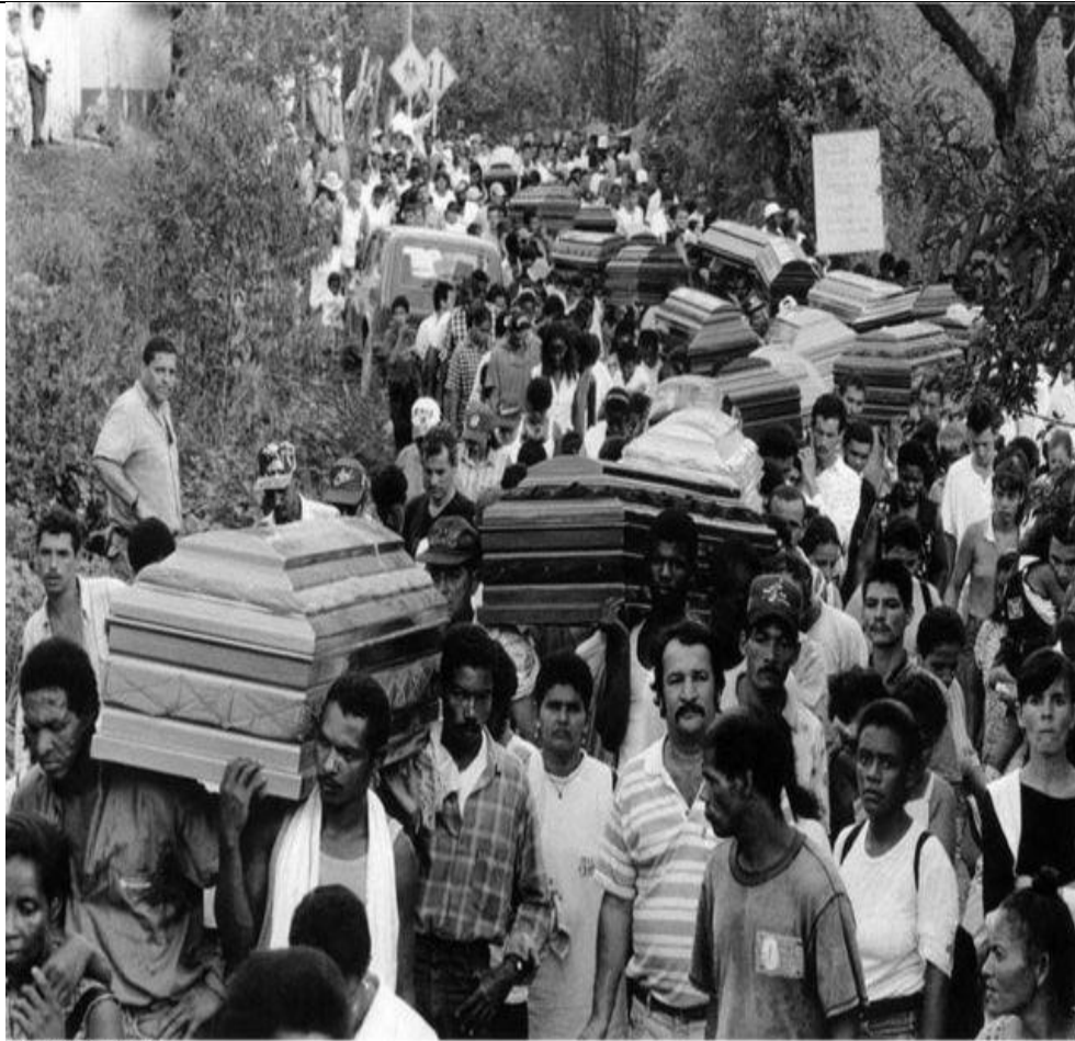
Sechuca, Antioquia, 1998