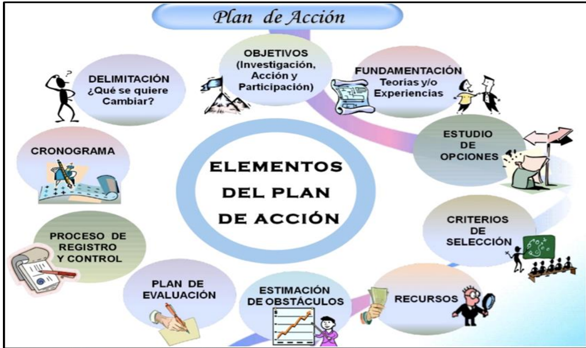
Imagen en https://reinaldoelso.wordpress.com/2017/04/30/propuesta-de-acciones-investigacion-accion/