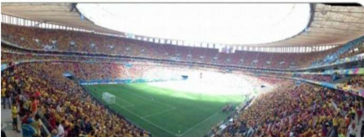
Figura 9. Hinchas de la selección Colombia en el partido Colombia Vs. Costa de Marfil, 19 de junio de 2014.

12. Relaciona lo aprendido con tu vida cotidiana. Completa un formato como el del ejemplo en el que plasmes escenas de tu cotidianidad que tengas rasgos románticos, realistas o costumbristas.