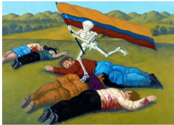
Pintura de Fernando Botero