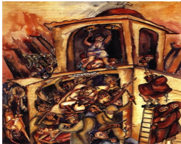
Pintura de Devora Arango.