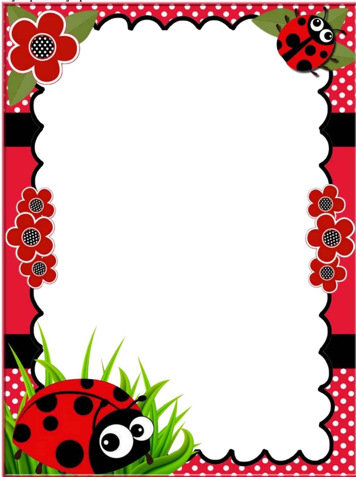
Ilustración 3.

En esta hoja colocas tu nombre y el nombre que le darás a tu proyecto