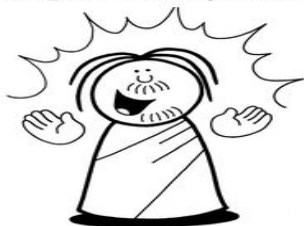
Ilustración 1. Imagen Google. Luz del mundo

Nos dicen simplemente que nuestro mundo , en el corazón y en la mente de Dios , es " casa de armonía y de paz " y un lugar en el que todos pueden encontrar su puesto y sentirse "en casa", porque "es bueno". Toda la creación forma un conjunto armonioso, bueno, pero sobre todo los seres humanos, hechos a imagen y semejanza de Dios, forman una sola familia , en la que las relaciones están marcadas por una fraternidad real y no sólo de palabra: el otro y la otra son el hermano y la hermana que hemos de amar, y la relación con Dios, que es amor, fidelidad, bondad, se refleja en todas las relaciones humanas y confiere armonía a toda la creación. El mundo de Dios es un