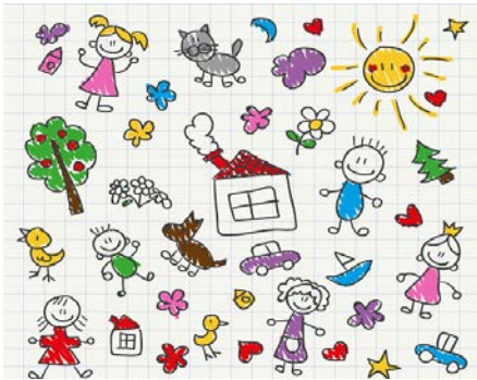
Ilustración 2 y 3 Imagen Google, Vidas