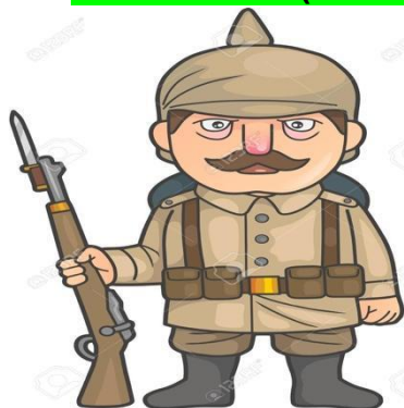
Ilustración 1. Imagen Google. Soldado