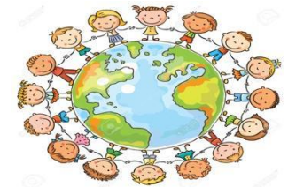
Ilustración 2 Imagen Google. Niños