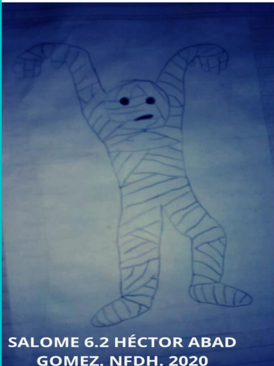
SALOME 6.2 HÉCTOR ABAD GOMEZ. NFDH. 2020

Gran conocimiento de ellos mismos y mucha sensibilidad a los problemas de los demás.