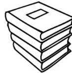
LOS LIBROS THE BOOKS

Si notas en el ejemplo, las palabras señaladas varían. En la primera imagen hay un libro por lo que se utiliza el y en la segunda imagen se utiliza los para indicar varios. Estas palabras son llamadas artículos que expresan: