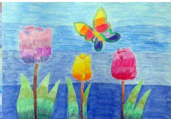
Escala de color