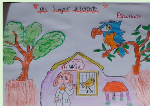
Lyam Moisés Arraiz Azuaje. Segundo 4