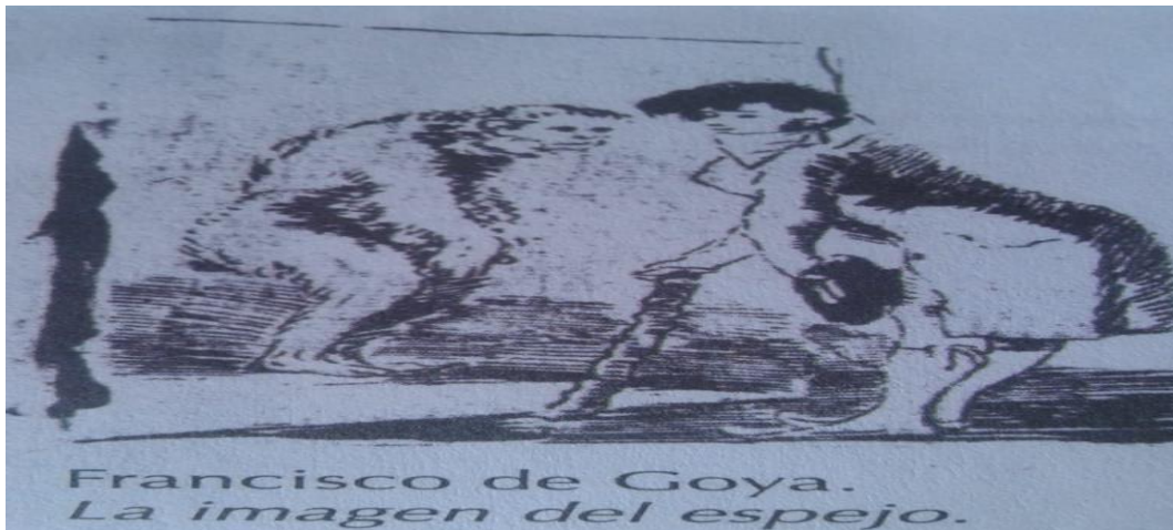
Francisco de Goya. La imagen del espejo.

3. ¿Cuál es la intención satírica de las caricaturas “La imagen del espejo y la pesca de sirenas”?