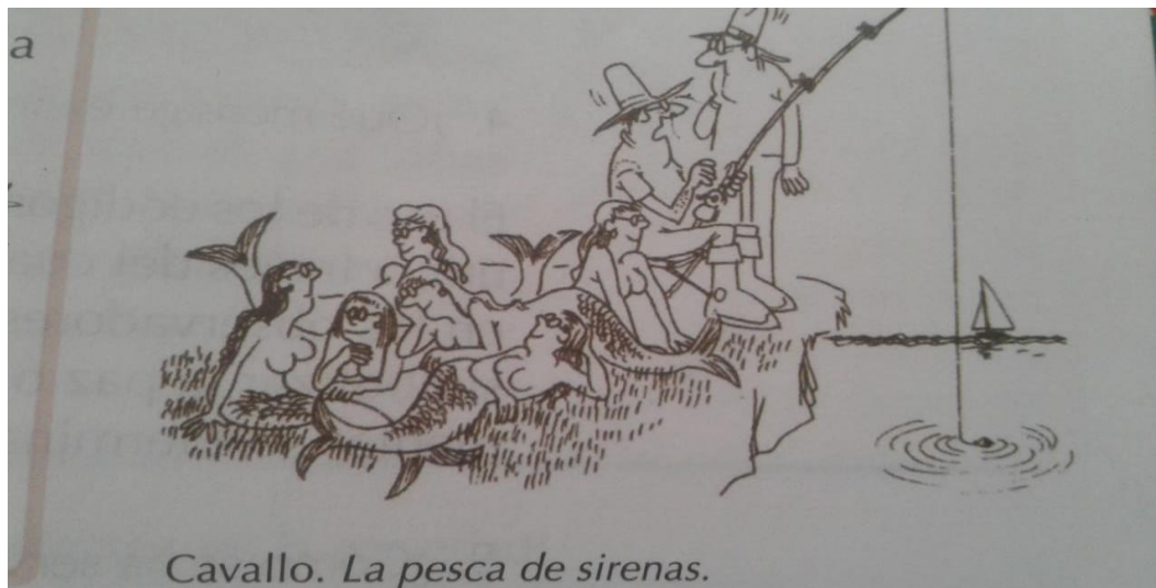
Cavallo. La pesca de sirenas.