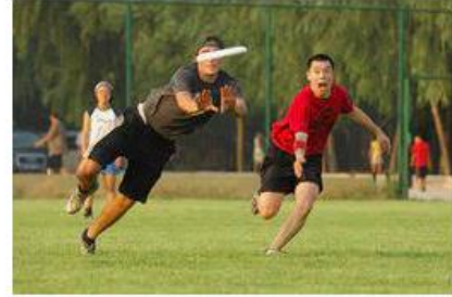
Deporte Alternativo - EcuRed ecured.cu