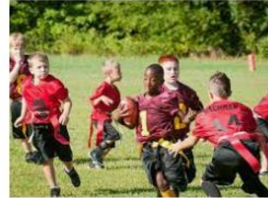
La llegada de los deportes alternativos ... auca.es