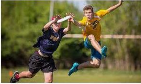
Qué son los deportes alternativos? elcierredigital.com