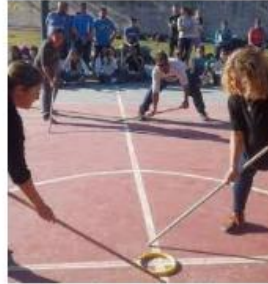
Deportes alternativos, una ... mendovoz.com