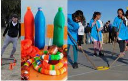
Deportes alternativos para pasar la cuarentena jujuymomento.com