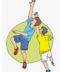
Deportes y juegos alter... abc.com.py