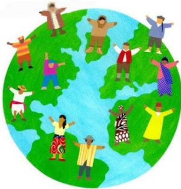
Ilustración 1. http://estudiantes.iems.edu.mx/cired/html/articulos/politicainformatica/IdentidadOtridad.html