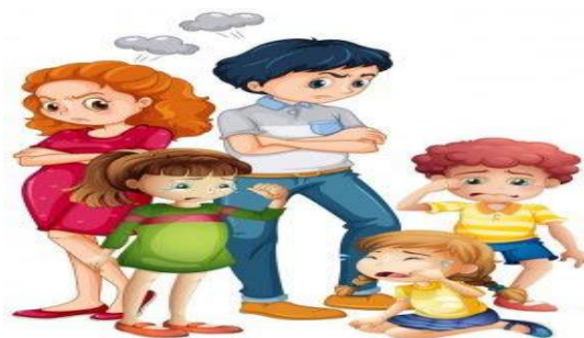
Ilustración 2 y 3 Imagen Google Familias