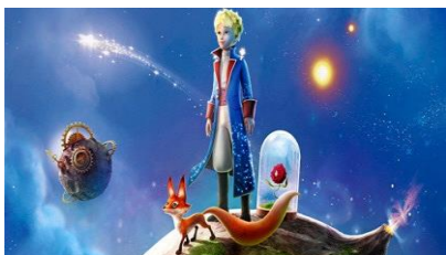
Ilustración 1. Imagen Google. El Principito

Nos dicen simplemente que nuestro mundo , en el corazón y en la mente de Dios , es " casa de armonía y de paz " y un lugar en el que todos pueden encontrar su puesto y sentirse "en casa", porque "es bueno". Toda la creación forma un conjunto armonioso, bueno, pero sobre todo los seres humanos, hechos a imagen y semejanza de Dios, forman una sola familia , en la que las relaciones están marcadas por una fraternidad real y no sólo de palabra: el otro y la otra son el hermano y la hermana que hemos de amar, y la relación con Dios , que es amor, fidelidad, bondad , se refleja en todas las relaciones humanas y confiere armonía