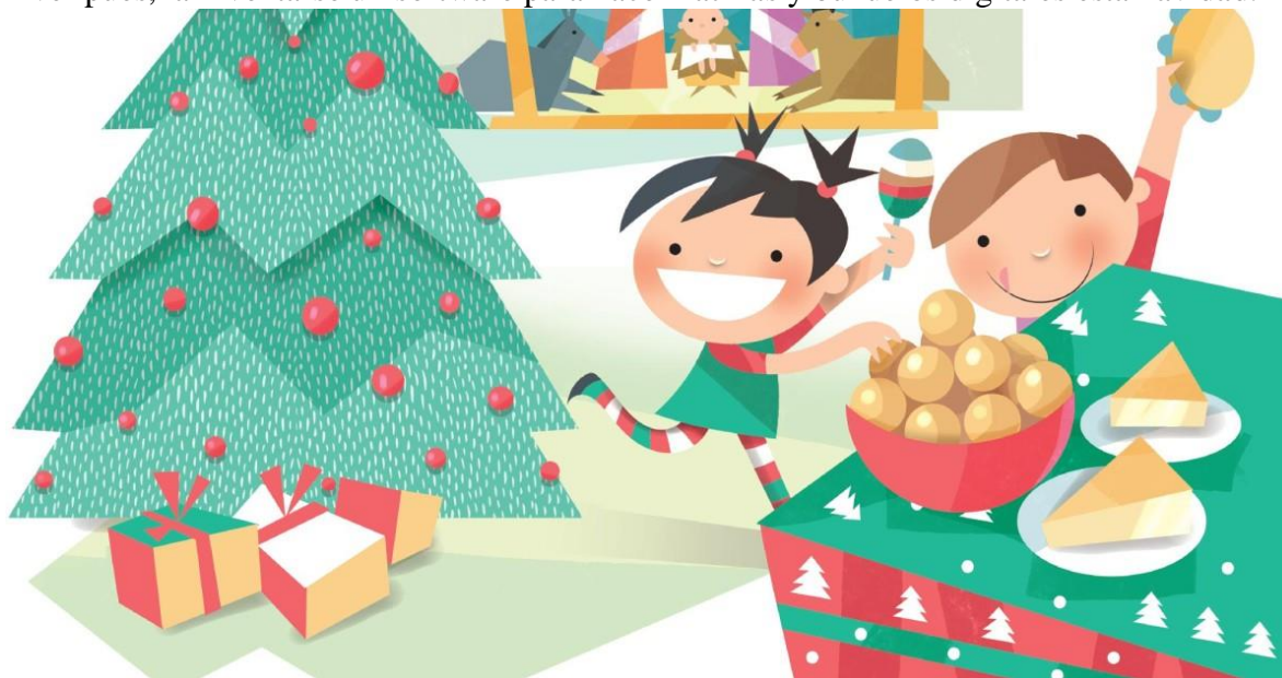
Ilustración 6 Los cuentos detrás de tradiciones navideñasLos cuentos detrás de tradiciones navideñas

Aver pues, a inventarse un software para hacer natillas y buñuelos digitales esta navidad.