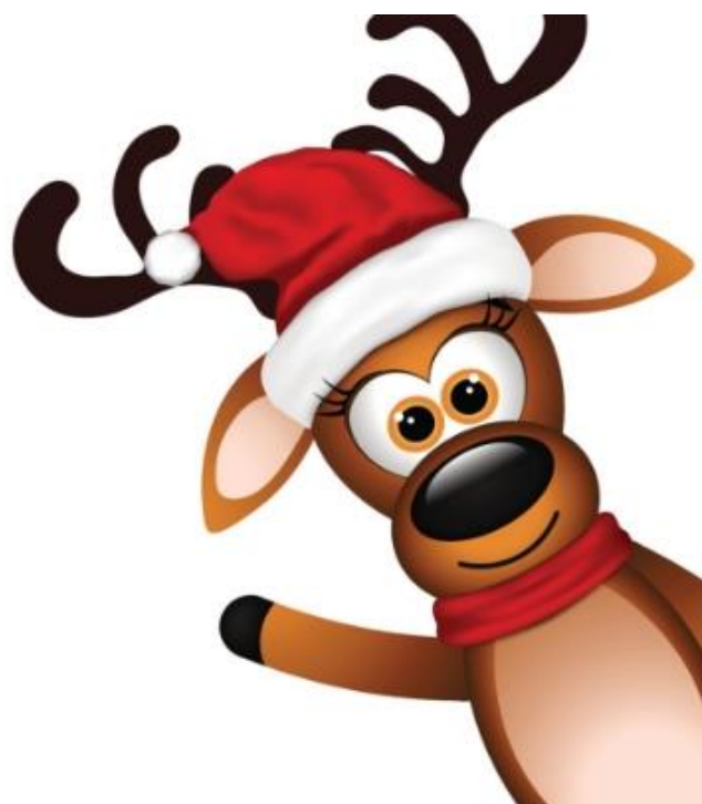
Ilustración 3 Chistes de Navidad para adultos