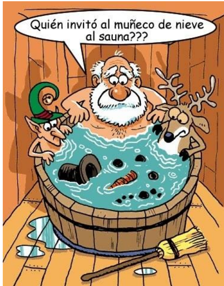
Ilustración 5