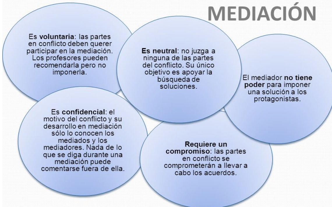
Ilustración 1. https://slideplayer.es/slide/1022562/