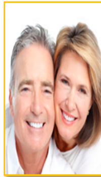
Ilustración 21: Etapa de la adulterez Fuente: Etapasdesarrollohumano.com. (N.A). Modificado por González, J. (2019).