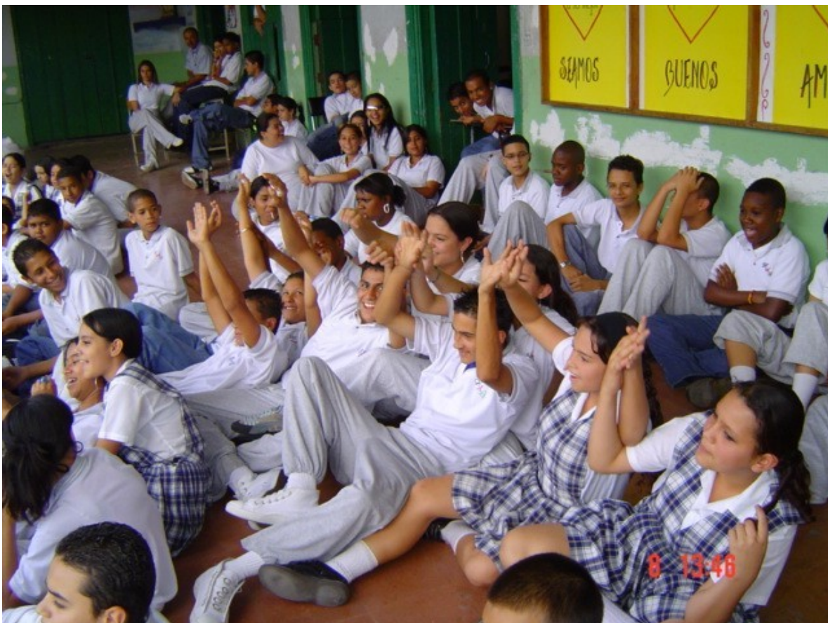
Ilustración 1