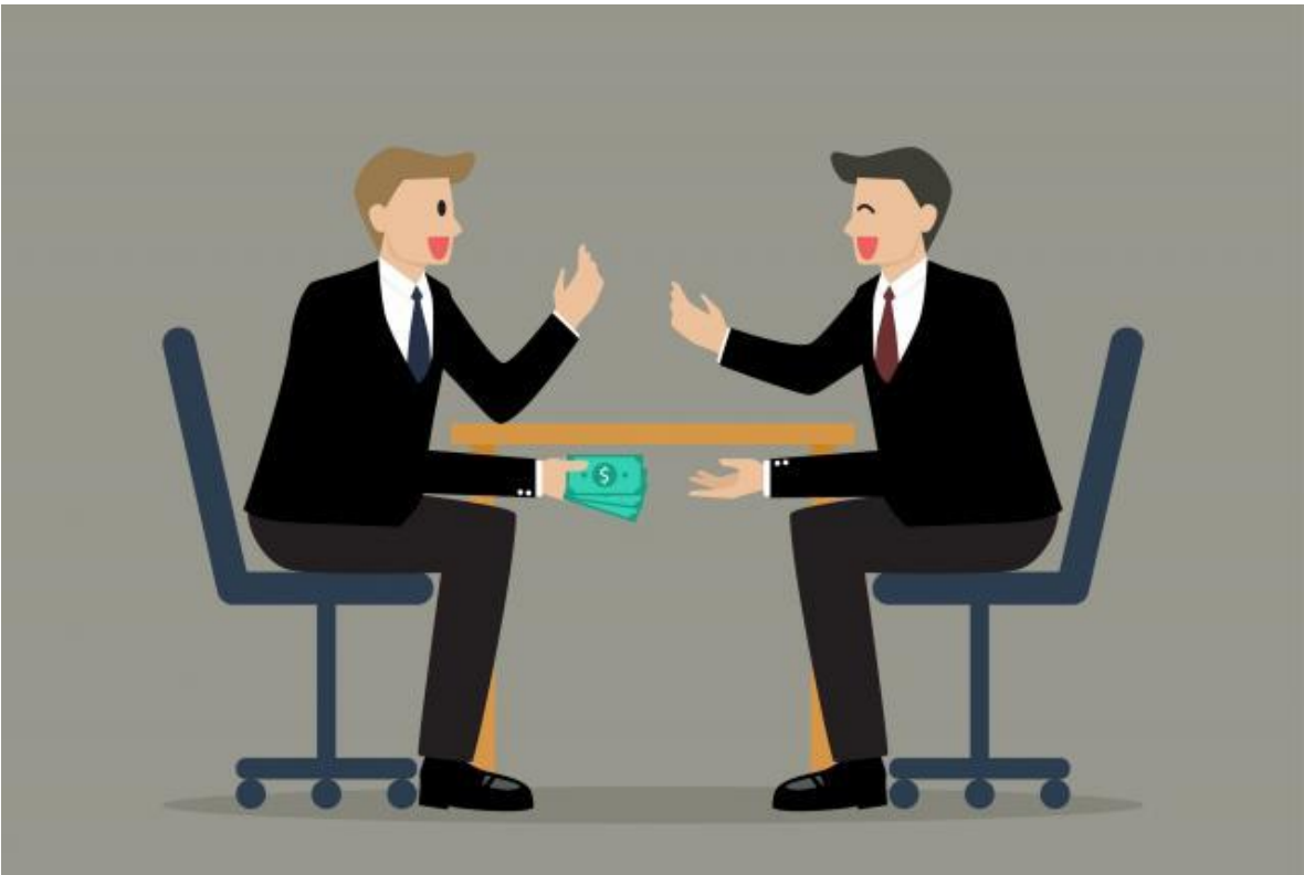
Ilustración 2