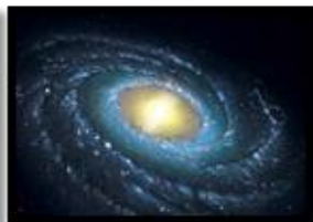
Espiral (Vía Láctea)