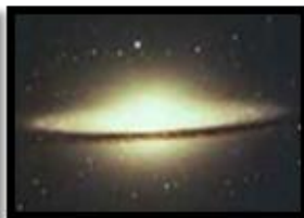
Lenticular (Drm 23)