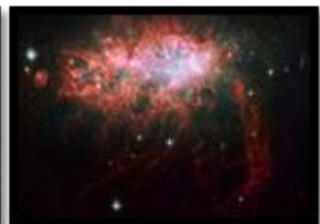
Irregular (NGC 1569)