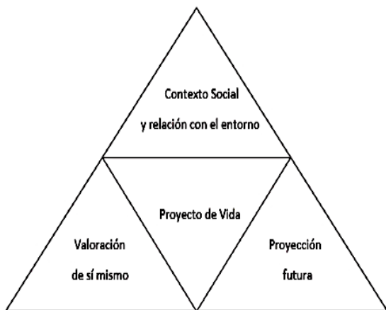
Ilustración 1. Imagen Google. Esquema