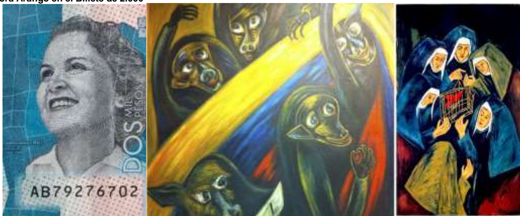
Devora Arango en el Billete de 2.000