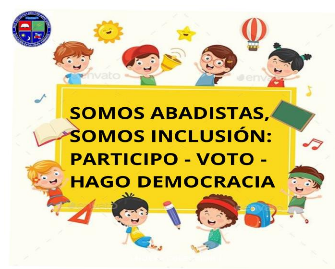
Ilustración 1 Celene Gallego Castrillón. Adaptó de Pinterest