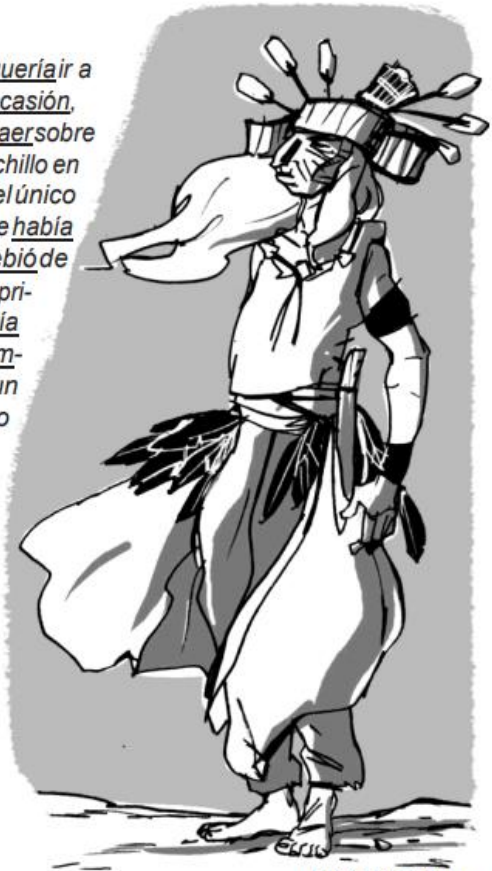
Jordi SIERRA I FABRA