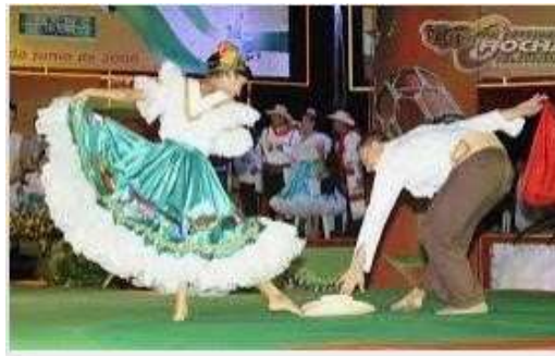
El Sanjuanero huilence