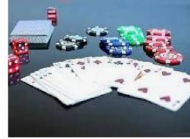
Qué son los Juegos de Mesa? » Su Defini... conceptodefinition.de