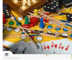
Concepto De Los Juegos De Mesa F...