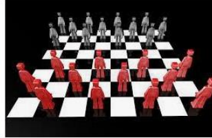
Concepto Del Juego De Mesa Del Inspector Sto...