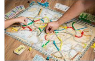
> Tipos de juegos de mesa: qué tipos existen ... juegosdemesayrol.com