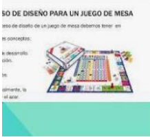
de Diseño de un juego de Mesa are.net