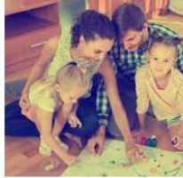
Definición de Juego de Mesa (... definicionabc.com