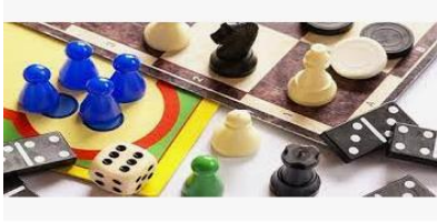
Juegos de mesa | Guías Prácticas.COM guiaspracticas.com