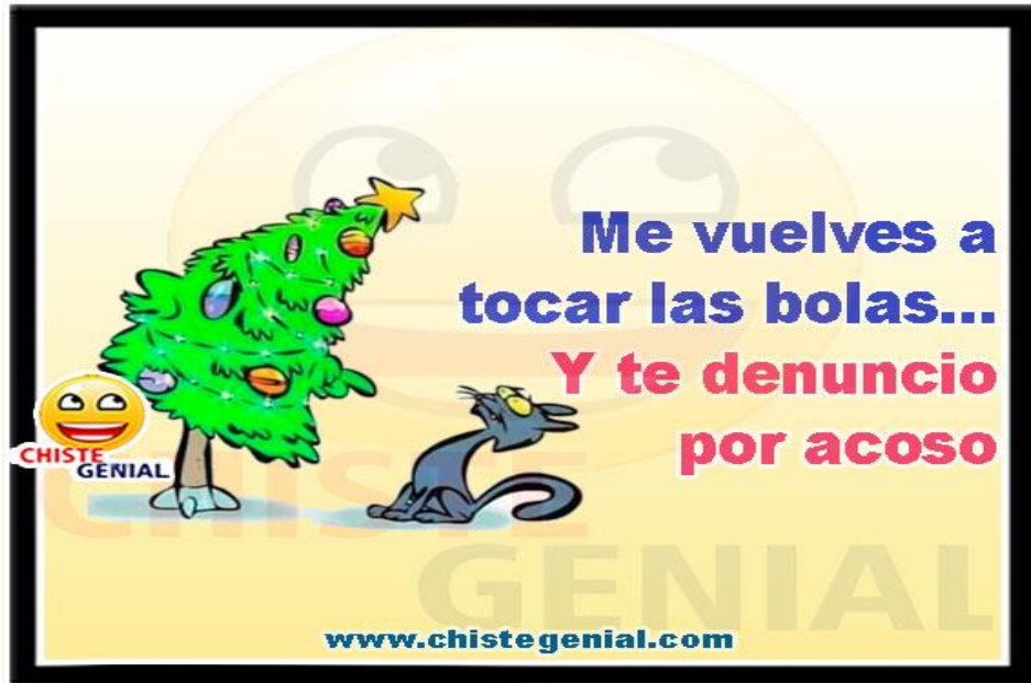
Ilustración 3 https://www.chistegenial.com/espirtu-navideno/

2. Desde el NÚCLEO DE DESARROLLO HUMANO, tomando en cuenta los componentes de ética y política en cuanto a los derechos fundamentales, ¿la imagen hace referencia a qué tipo de acoso?