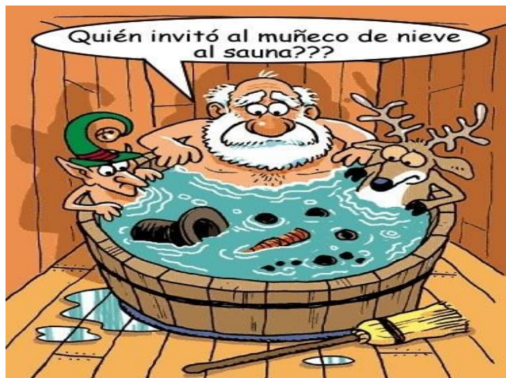
Ilustración 4

1. Desde el NÚCLEO LÚDICO RECREATIVO analiza: ¿Qué pasó cuando el muñeco de nieve se metió al sauna?