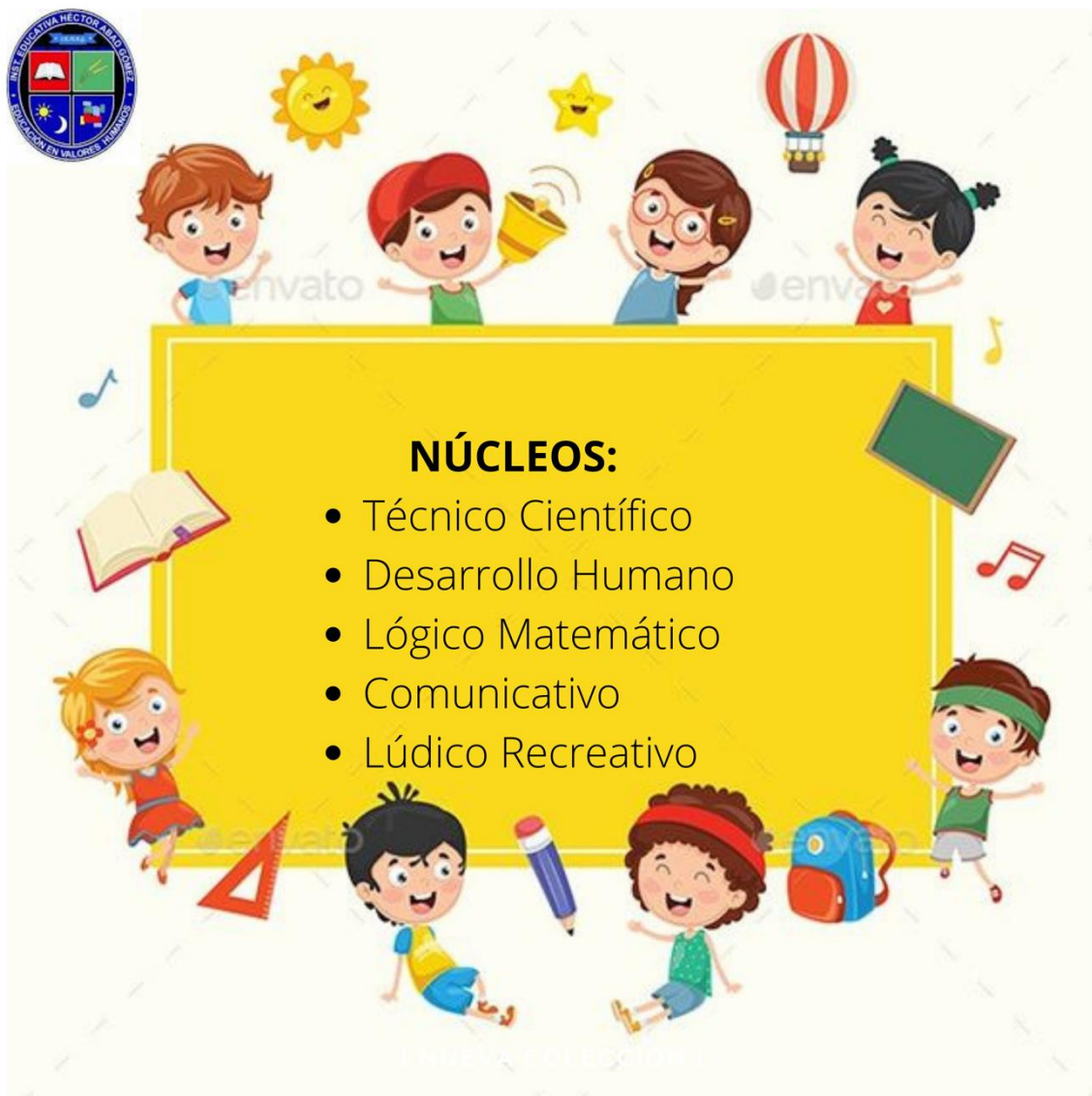
Ilustración 1. Adaptada de Pinterest Celene Gallego Castrillón. 2021

Con una ilustración o dibujo, expresar como se sintió durante el semestre con las diferentes asesorías impartidas por cada uno de los Núcleos: