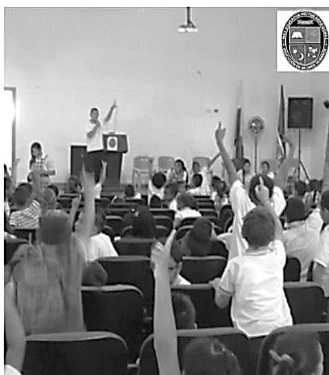
Ilustración 1. Foto archivo I.e. Héctor Abad Gómez