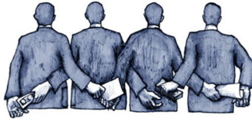
Ilustración 2.El Reto de Enfrentar la Corrupción - Información y Noticias FIIC