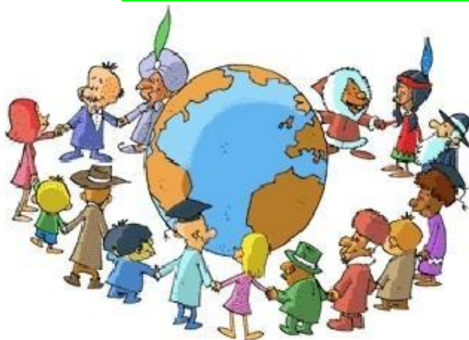
Ilustración 1 https://docplayer.es/72871291-Contextos-de-la-comunicacion.html

Para el desarrollo de la actividad ten en cuenta el título.