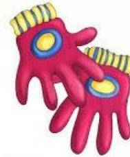
Los guantes ... (Plural) Género: masculino

Los artículos definidos se usan cuando el objeto es conocido.