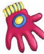
El quante (Singular) Género: masculino