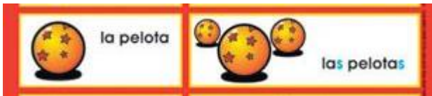
(Singular) (Plural) Género: femenino

Un artículo es una clase de palabra que acompaña al sustantivo dentro de una oración que se expresan en igual género (masculino o femenino) y número (singular o plural)