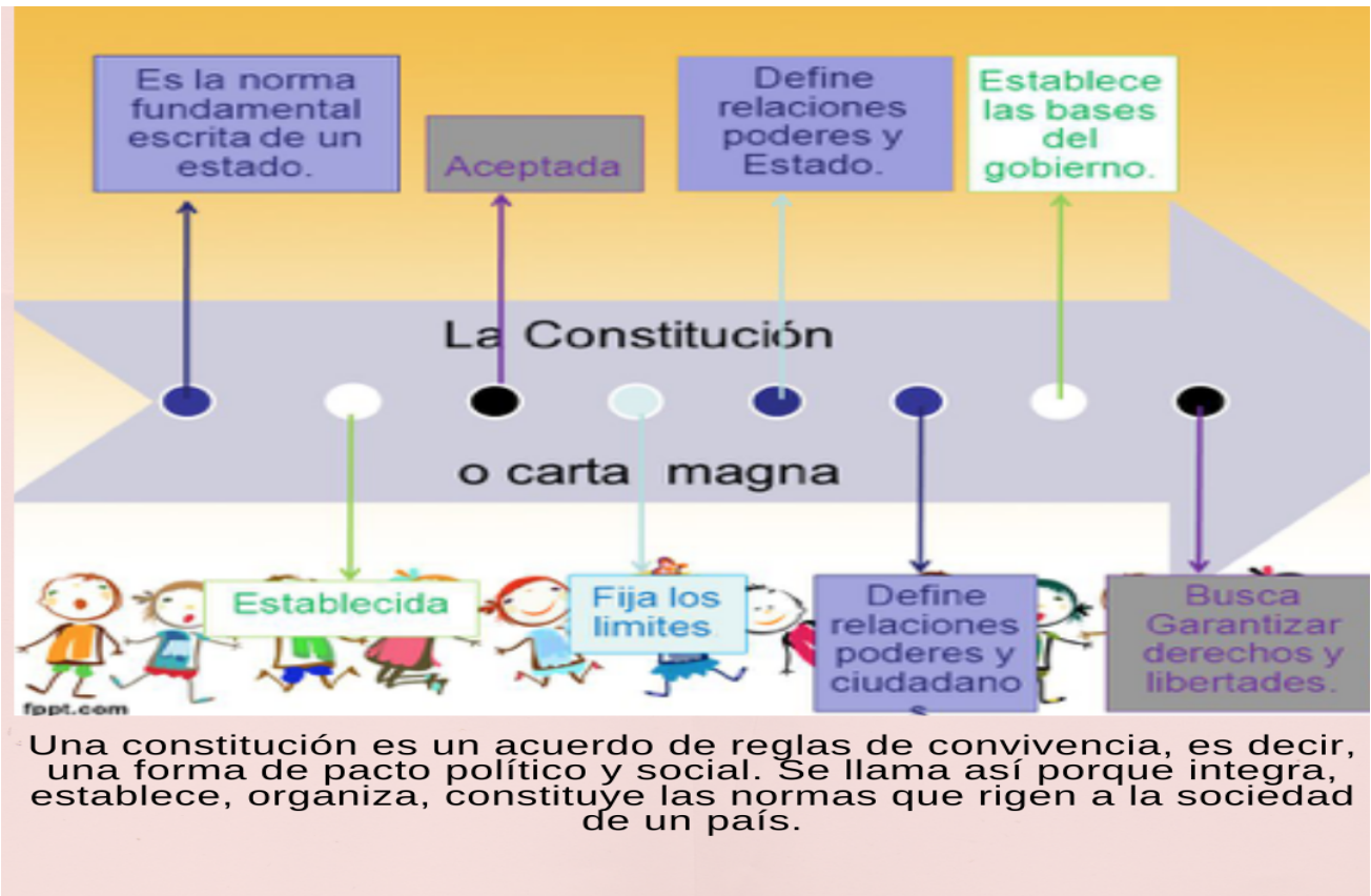
Ilustración 1. Google, adaptó Celene Gallego Castrillón