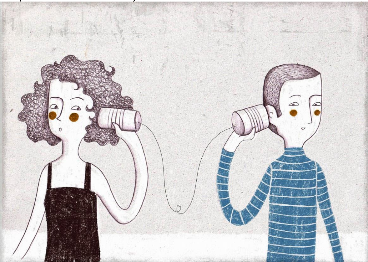
Ilustración 2. Los caminos de la “escucha”. | Miss Social

Identificar y recurrir a los componentes de la comunicación que permitan la comprensión entre el locutor y el interlocutor.