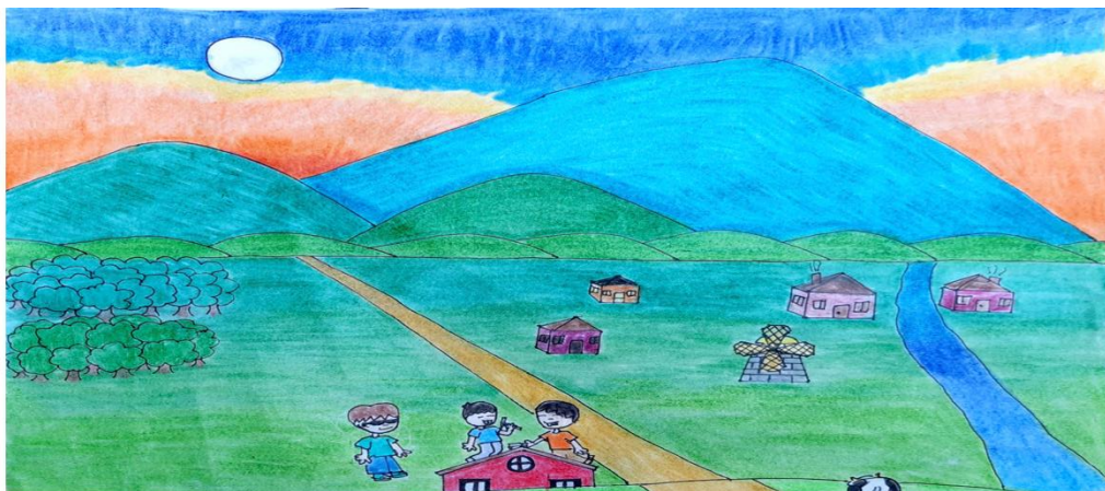
Ilustración 1. VARGAS TORREGLOSA ANDRÉS FELIPE. CLEI VI 07 NFDH