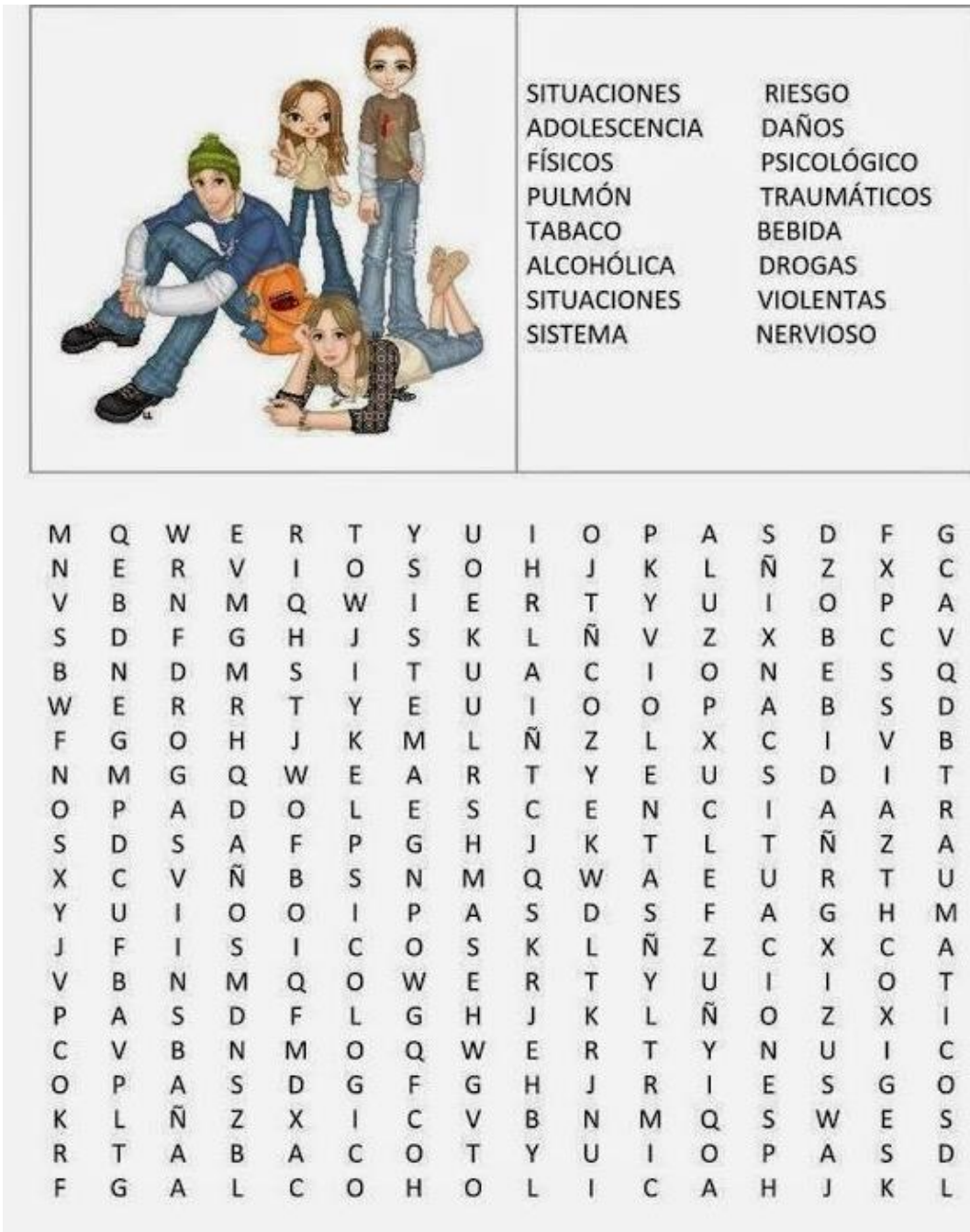
Ilustración 3sopa de letras para adolescentes para imprimir imagui sopa de letras para adolescentes para imprimir imagui | Spanish classroom, Teaching, Learning