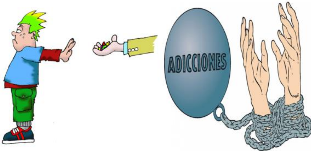
Ilustración 1 Pin en Prevención drogas Pin en Prevención drogas

Ilustración 2 https://www.pinterest.es/pin/565905509426412529/