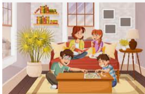
Ilustración 2 y 3 Imagen Google Familias