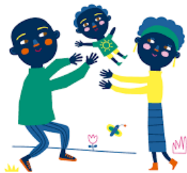
Ilustración 1. buen trato niños.

Nos dicen simplemente que nuestro mundo , en el corazón y en la mente de Dios , es " casa de armonía y de paz " y un lugar en el que todos pueden encontrar su puesto y sentirse "en casa", porque "es bueno". Toda la creación forma un conjunto armonioso, bueno, pero sobre todo los seres humanos, hechos a imagen y semejanza de Dios, forman una sola familia , en la que las relaciones están marcadas por una fraternidad real y no sólo de palabra: el otro y la otra son el hermano y la hermana que hemos de amar, y la relación con Dios, que es amor, fidelidad, bondad , se refleja en todas las relaciones humanas y confiere armonía a toda la creación. El mundo de Dios