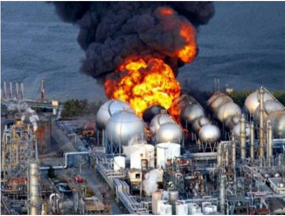
Illustration 2contaminación radioactiva | Nuclear radiation, Nuclear disasters, Nuclear power plantcontaminación radioactiva | Nuclear radiation, Nuclear disasters, Nuclear power plant