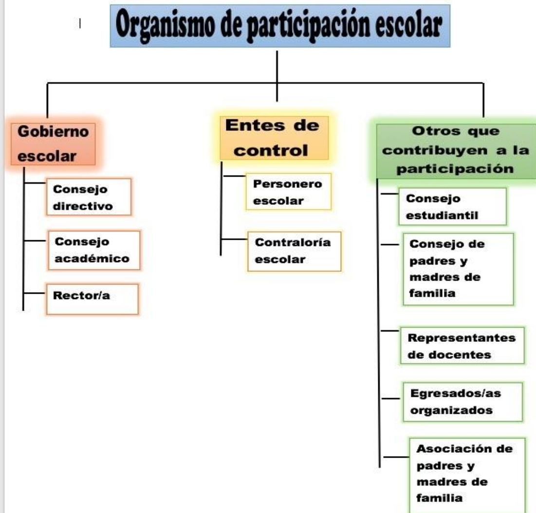
Ilustración 2. Proyecto Democracia 2021.IEHAG

apertura democrática no puede existir sin participación popular. En los barrios la gente tiene que aprender a