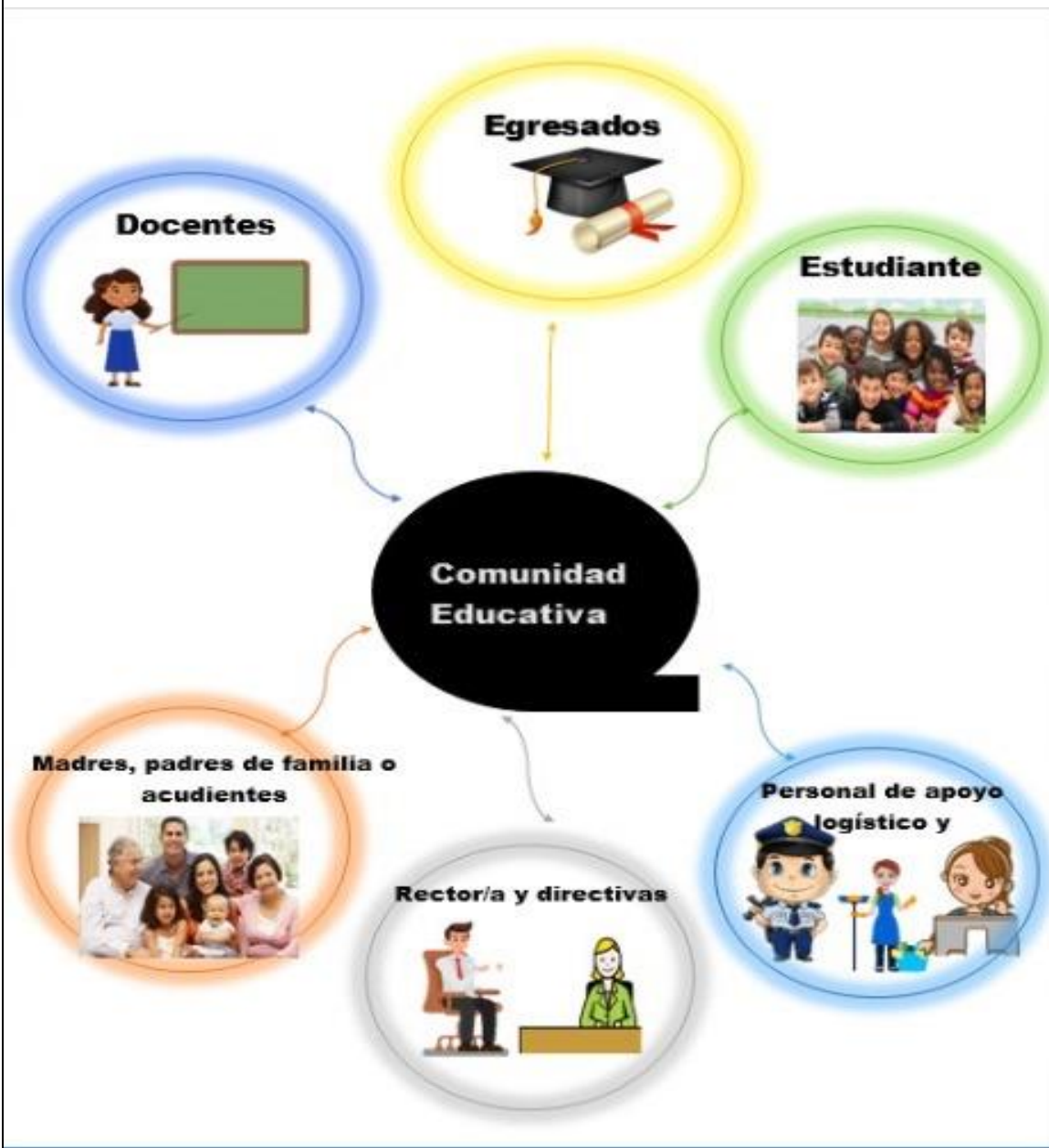
Ilustración 1. Ilustración 2. Proyecto Democracia 2021. IEHAG

Ponga dos ejemplos en los que se está vulnerando el estado social de derecho. TALLER SOBRE LA LECTURA Y ANALISIS DEL DOCUMENTO