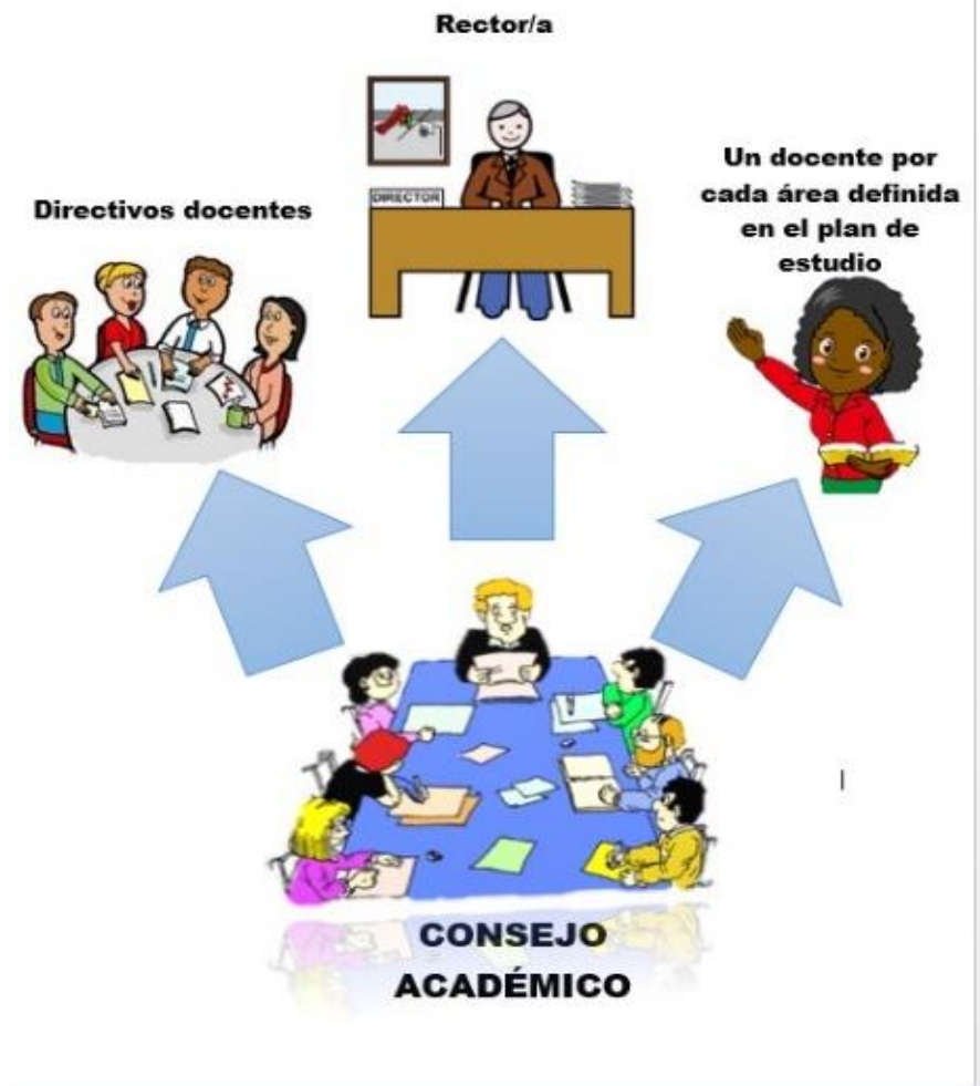
Ilustración 4. Ilustración 2. Proyecto Democracia 2021.IEHAG