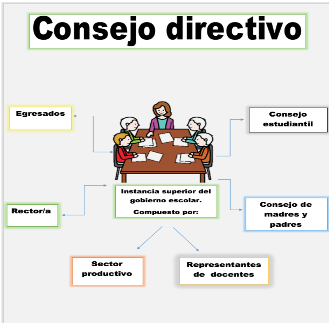
Ilustración 3. Ilustración 2. Proyecto Democracia 2021.IEHAG