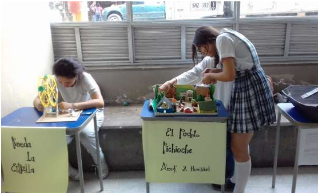
Ilustración 1. SEMANA ABADISTA. DÍA CIENTIFICO 2018