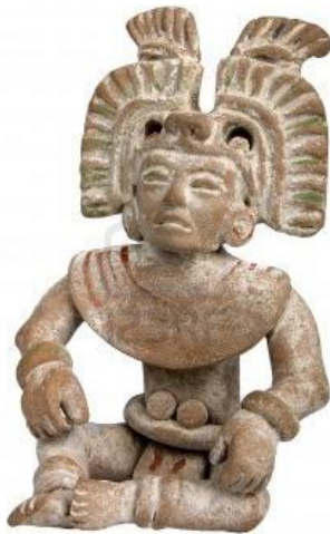
“Figurilla Maya de terracota”

La civilización Maya es una de las principales organizaciones étnicas de América. Fueron ellos quienes crearon el primer sistema de escritura basado en jeroglíficos en este lado del mundo, se destacaron por sus conocimientos matemáticos y sus deducciones científicas.