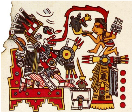
"Códex Borgia". Códice mixteca del siglo XIV-XVI.

ual se dividió en cuatro partes según las características que muestran los asentamientos de las diferentes culturas así: Suroeste mexicano (Cultura Maya), Golfo de México (culturas Olmeca, Huasteca y Totonaca), culturas del Altiplano Centrales (culturas Teotihuacana, Tolteca y Azteca), culturas de Oaxaca (Zapotecas y Mixtecas) y culturas de Occidente (Colima, Nayarit, Jalisco y Guerrero).