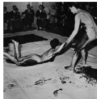
Yves Klein, Sinfonía monótona , 1960

Esta es una de las obras más conocidas del arte conceptual, en ella Kosuth realiza una instalación, (presentación de los objetos en el espacio real) en la que se presentan una silla real, una fotografía de la misma silla y una definición del diccionario de la palabra "silla". Con esta propuesta el artista quiere hacer una reflexión sobre las relaciones entre el arte y la realidad y, a la vez, indagar por los diferentes tipos de representación.