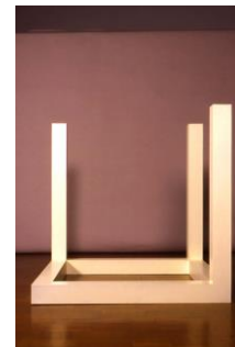
Sol Lewit, cubo abierto 7/1 , 1974

En la obra de Donal Judd, los objetos adosados a la pared, nos muestran la inquietud que el artista quiere despertar en el espectador, sobre si lo que ve es un objeto o varios.