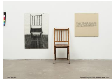
Joseph Kosuth, Una y tres sillas , 1965

La obra de Robert Smithson es uno de los ejemplos más conocidos del land art . En esta pieza Smithson va a un lago de Estados Unidos y realiza una composición efímera con tierra y piedras en forma de espiral. Sabemos que la pieza desaparecerá, pero quedará el registro de esta acción inolvidable donde el hombre interactúa con el entorno para dejar una huella significativa.