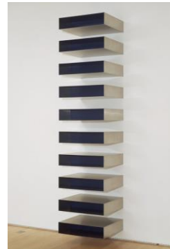
Donal Judd, sin titulo , 1969 - 1982

este caso las dos planchas de plomo de varias toneladas de peso están puestas una sobre la otra sin ninguna fijación, provocando una sensación de inestabilidad y peligro en el espectador.