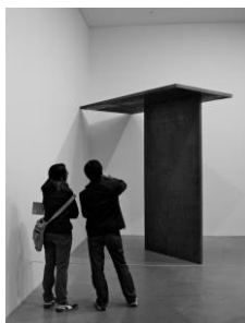
Richard Serra, trip hammer , 1989

En la anterior imagen, observamos como Charles Ronal Bladen dispone tres elementos al aire libre, crean en el espectador la sensación de que, aunque son cosas que reproducen figuras abstractas, podrían caer por su inclinación.