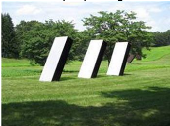
Charles Ronald Bladen, tres elementos , 1967

A continuación, se explicarán tres obras minimalistas y comentarlas brevemente para que te hagas una idea de lo que perseguían estos artistas: