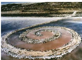
Robert Smithson, Muelle en espiral , 1970

Como resultado, produjeron piezas de arte que criticaban la manera moderna de producir, presentar y relacionarse con el arte, y que tenían lugar en sitios no convencionales. A continuación, presento piezas o prácticas artísticas representativas de las ideas procesuales, con una breve explicación.