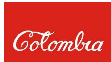
Antonio Caro, Colombia , 1978

El arte moderno en Colombia inspiró su trabajo en la autonomía de la obra de arte y una validación de lenguajes como la abstracción, los primeros artistas contradijeron los lenguajes clásicos de la pintura y la escultura y desarrollaron un arte de fuerte crítica social y cultural que abriría los caminos a las nuevas generaciones.