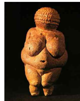
VENUS DE WILLWENDORF (20.000 a.C.) Como en todas las venus prehistóricas, en ésta figura se resaltan los atributos femeninos, especialmente el pecho y el vientre, lo que indica su alusión a la fecundidad o maternidad.

En 1940 dos investigadores franceses descubrieron que el arte rupestre hay composiciones cuidadosamente planificadas y cada animal no es un retrato si no un símbolo.