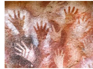
Cueva de las manos, con un grabado de manos de hace unos 9000 años. Santa Cruz, Argentina.

Sobre el significado del arte del Paleolítico se han formulado varias teorías. Una de ellas dice que estas pinturas tenían un fin mágico que influenciaba su vida real; así por ejemplo, la pintura de un bisonte, convocaría la caza del animal. Otra teoría nos habla de la magia de la fertilidad. La representación de los animales garantizaría su reproducción y por consiguiente la provisión de alimentos en el futuro.